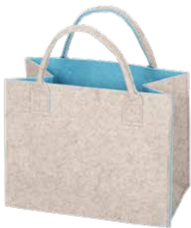
8191/HB 35x20x30/43 cm (LxBxH)