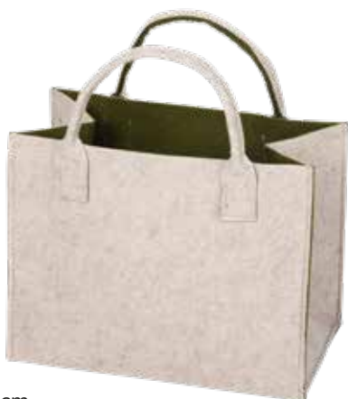
8191/GR 35x20x30/43 cm (LxBxH)