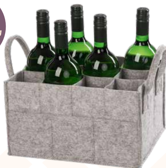
6975/12D 31x23x18/25 cm (LxBxH)