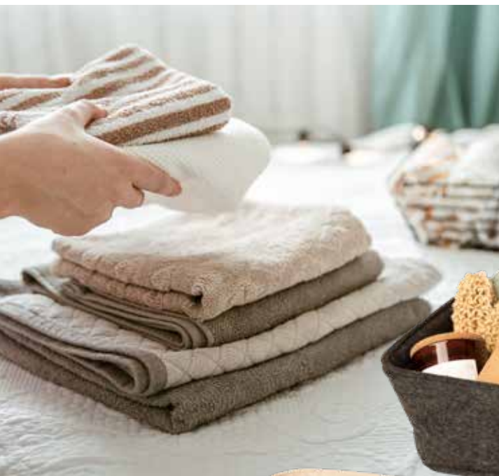
8195/2DG 30x25x11 cm (LxBxH)