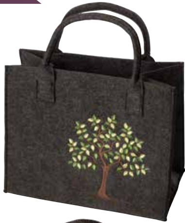
8190/1D 35 x 20 x 30/43 cm (LxBxH)