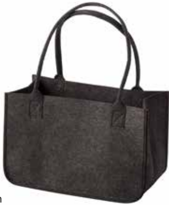
8165/DG 37 x 20 x 24/50 cm (LxBxH)