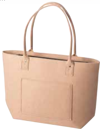
8164/B 33 x 15 x 30/54 cm (LxBxH)