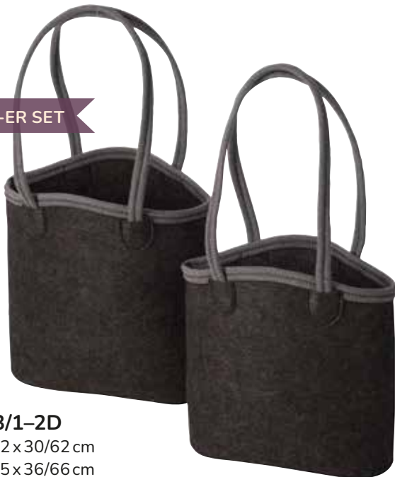
8163/1-2D 30 x 12 x 30/62 cm 35 x 15 x 36/66 cm (LxBxH)