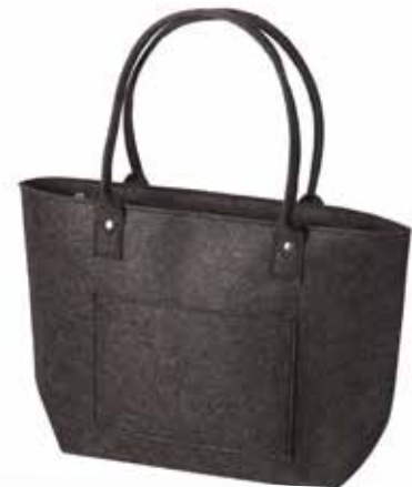
8164/DG 33 x 15 x 30/54 cm (LxBxH)