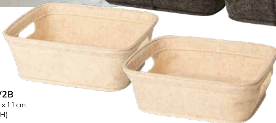
8195/2B 30x25x11 cm (LxBxH)