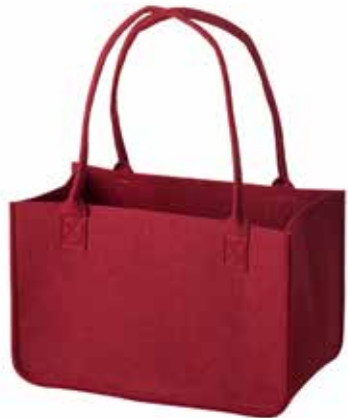
8165/R 37 x 20 x 24/50 cm (LxBxH)