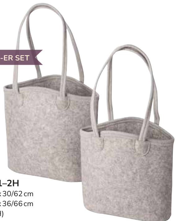
8163/1-2H 30 x 12 x 30/62 cm 35 x 15 x 36/66 cm (LxBxH)