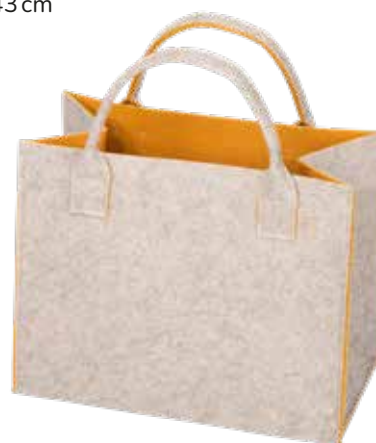
8191/GE 35x20x30/43 cm (LxBxH)