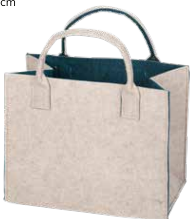
8191/DB 35x20x30/43 cm (LxBxH)