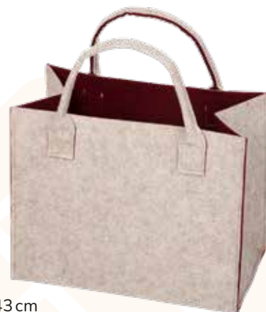
8191/WR 35x20x30/43 cm (LxBxH)