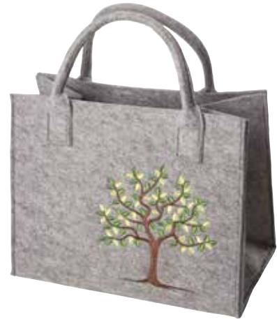
8190/1H 35 x 20 x 30/43 cm (LxBxH)