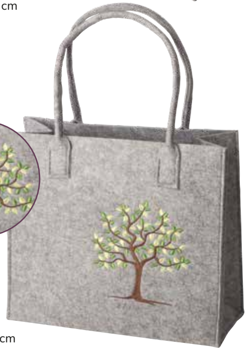
8190/2H 40 x 18 x 35/60 cm (LxBxH)