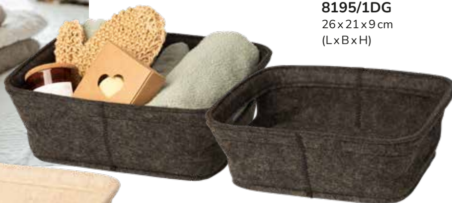
8195/1DG 26x21x9 cm (LxBxH)