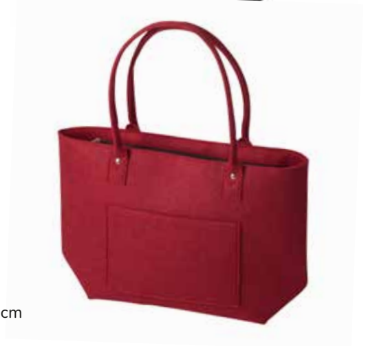
8164/R 33 x 15 x 30/54 cm (LxBxH)