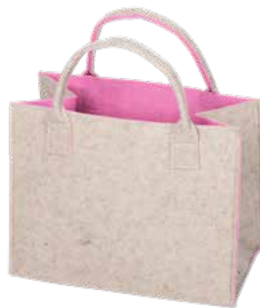
8191/HR 35x20x30/43 cm (LxBxH)