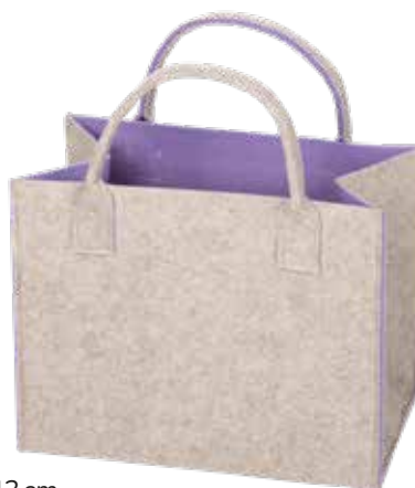
8191/L 35x20x30/43 cm (LxBxH)