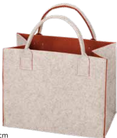
8191/Z 35x20x30/43 cm (LxBxH)