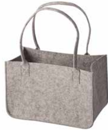
8165/HG 37 x 20 x 24/50 cm (LxBxH)