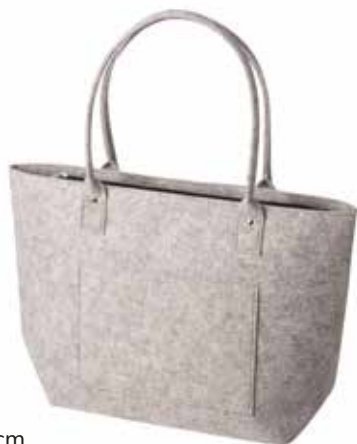
8164/HG 33 x 15 x 30/54 cm (LxBxH)