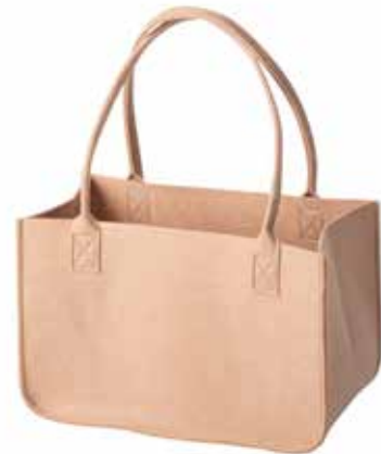
8165/B 37 x 20 x 24/50 cm (LxBxH)