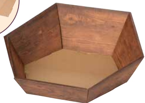
8177 32x32x6/10cm (LxBxH)